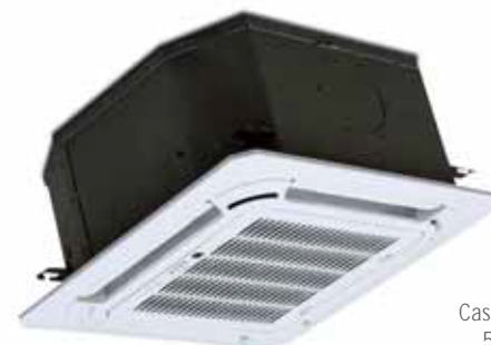
Cassette DC 18 HP N 570x570x260 mm