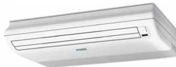
Floor DC 18 HP- DC 24 HP 980x660x203 mm - 990x660x203 mm

FUNCION AUTO: Regula los parámetros de funcionamiento en función de la temperatura ambiente.