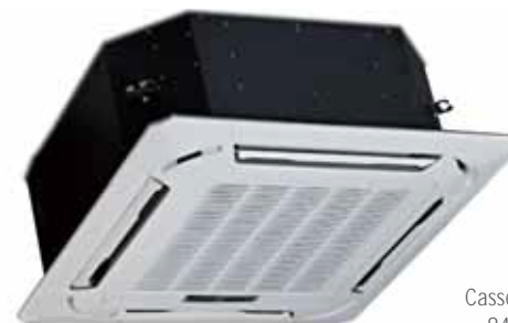
Cassette DC 24 HP N 840x840x230 mm