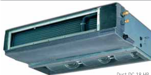
Duct DC 18 HP - DC 24 HP 1095x295x805 mm