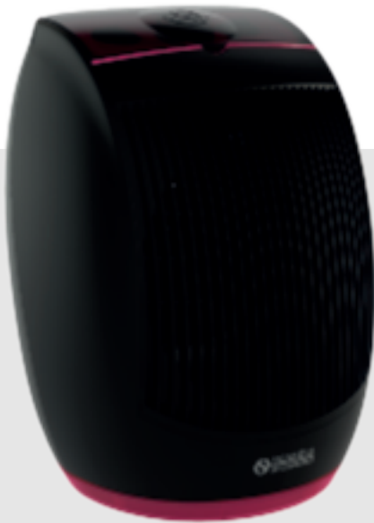
NORMANN Cod. 99573